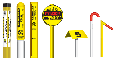
From left to right: TriView™ Marker, Dome Marker, Flat Marker, Round Marker, Aerial Marker, Casing Vent Markers.

Although not present in certain areas, these can be found at road crossings, fence lines, and street intersections. The markers display the product transported in the line, the name of the pipeline operator, and a telephone number where the operator can be reached in the event of an emergency.